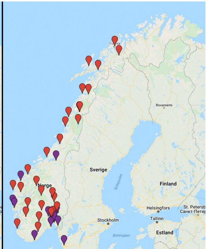
Venstre: Utplasserte Ladefondsladere - Høyre: Utplasserte CHAdeMO-adaptore